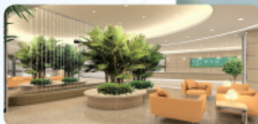
Longrich Lobby & Reception Rooms