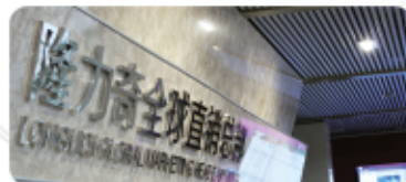
Longrich Global Marketing Headquarters

누구나 성공을 꿈꾸지만, 결국 꿈을 실현시키는 사람은 많지 않습니다. 대부분의 사람들이 꿈을 이룰 수 있는 기회를 위한 발판을 찾지 못하기 때문입니다. 롱리치는 성공을 길잡고 꿈을 위해 노력을 멈추지 않는 모든 분들을 위해 다양한 기회의 발판을 제공합니다.