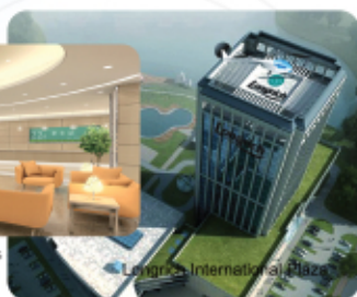
Longrich International Plaza