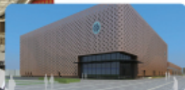
Longrich New Intelligent Plant