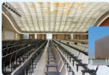
Longrich Grand Conference Hall (2,000 seats)